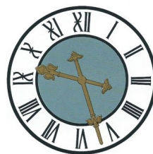
C) 922 b

16) Was hat Gottlieb Röhm im Putzraum unter dem Aufgang zur Empore installiert?