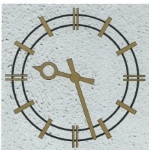
A) 303 g

15) Für welches Ziffernblatt hat man sich bei der Neuanschaffung der Turmuhr entschieden?